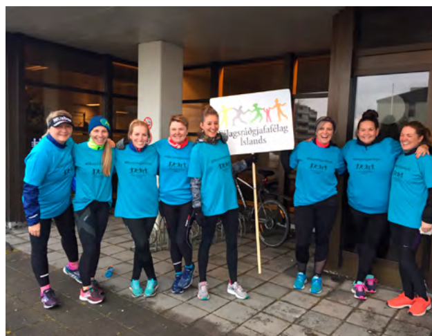
Mynd 1. Hlaupagarpar úr hópi félagsráðgjafa.

Í Fógetagarðinum var búið að koma fyrir kassa og hljóðkerfi. Þar stigu félagsráðgjafar á stökk og lásu upp texta sem lýstu fátækt og aðstæðum þeirra sem búa við fátækt. Mátti þar meðal annars heyrja skilgreiningu á