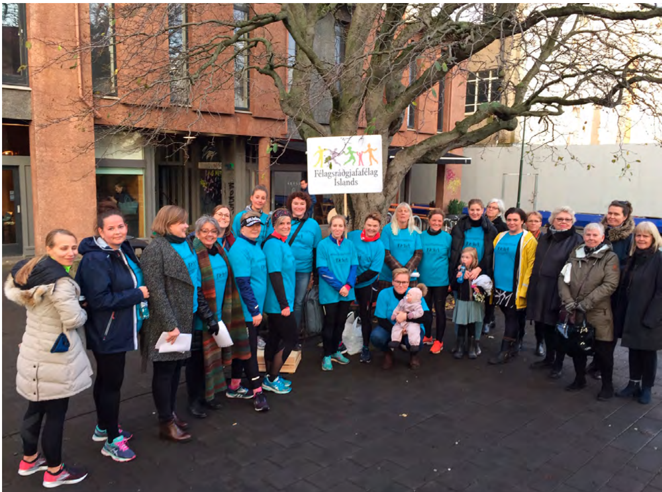
Mynd 3. Góður hópur félagsráðgjafa tók þátt í gjörningnum í tilefni af alþjóðabaráttudegi gegn fátækt.