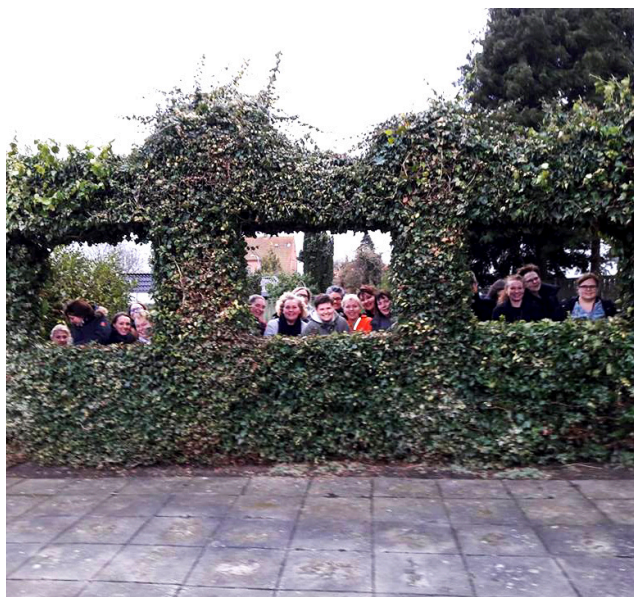
Íslenski hópurinn við Familiehuset.

Eftir að stjórnendur í Nyborg höfðu farið í heimsókn til Svíþjóðar og kynnt sér „sænska módelið“ var tekið upp nýtt vinnulag í skóla- og félagsþjónustu í Nyborg í ársbyrjun janúar 2016, sem í stórum dráttum er byggt á hugmyndafræði og framkvæmd í Borås í Svíþjóð. Markmiðið var ekki síst að beita markvissri snemmtækri íhlutun með virku samstarfi fagaðila. Heimsókn okkar til Nyborgar hafði að markmiði að skapa sameiginlegan skilning og þekkingu á markmiði og vinnulagi að baki Nyborgar-líkaninu sem hefur þótt gefast einkar vel.