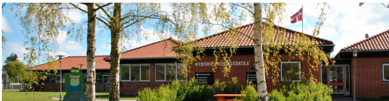
Nyborg heldagsskole, sérskóli fyrir börn með tilfinningalega- og hegðunarlega örðugleika.

nokkra daga um miðjan mars. Sveitarfélögin sem áttu fulltrúa í ferðinni voru Fljótsdalshérað, Fljótsdalshreppur, Vopnafjarðarhreppur, Seyðisfjarðarkaupstaður, Borgarfjörður eystri og Djúpavogshreppur. Allir grunn- og leikskólar sveitarfélaganna sem gátu komið því við sendu fulltrúa sína og þeir starfsmenn félagsþjónustunnar sem koma til með að vinna innan nýs teymis á Austurlandi fóru með ásamt félagsmála-