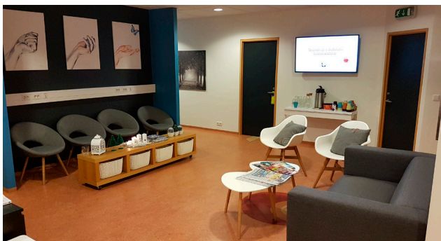
Frá biðstofu Lausnarinnar.

Hjá Lausninni starfa núna 14 meðferðaraðilar eða þerapistar og er starfsemin í Kópavogi, Selfossi og á Akureyri þar sem nýlega var opnuð starfsstöð. Meðferðaraðilar eru úr breiðum faghópi og hafa allir lokið viðurkenndu háskólanámi í meðferð einstaklinga og fjölskyldna eða eru á lokametrunum við það. Öllum meðferðaraðilum hjá Lausninni er skylt að vera í handleiðslu hjá viðurkenndum meðferðaraðilum öðrum en þeim sem starfa hjá Lausninni. Það er staðföst skoðun