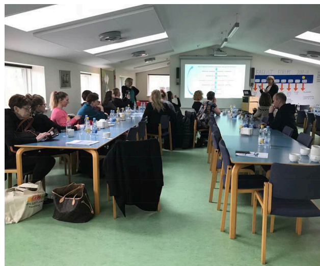
Hluti íslenska hópsins á fyrirlestri í Birkhoved skólanum.

Heimsóknin var í alla staði mjög vel heppnuð og skildi eftir sig góða viðbótarþekkingu á sænska módelinu auk vináttu- og samstarfstengsla við kollega í Nyborg. Þeir sem tóku þátt í ferðinni eru heillaðir af góðum anda, jákvæðni og samheldni þeirra sem vinna