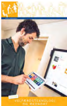
Ein af skýrslum Norrænu velferðarmiðstöðvarinnar um velferðartækni.

stétta, sveitarfélaga, atvinnulífs, fjálsra félagasamtaka, nærsamfélags og fjölskyldna. Úrræðin verða notenda-miðuð í enn meiri mæli og aðstoð löguð að hverjum og einum með samræmdum og heildstæðum hætti. Tæknin er síðan notuð til þess að auka öryggi við at-hafnir dagslegs lífs og gefa færi á hreyfanleika innan heimilis og utan. Áherslan er því lögð á nýsköpun og velferðartækni þar sem leiðarljósið er að nýta nú-verandi tækni og nýja tækni til að viðhalda lífsgæðum notenda eða auka þau.