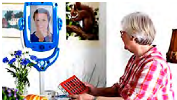
Heimsókn og innlit í gegnum myndsíma.

Í stefnuskjali velferðar-ráðuneytisins frá hausti 2015 voru lagðar línur um áherslusvið og aðgerðir á sviði nýsköpunar og tækni í velferðarþjónustu. Nú