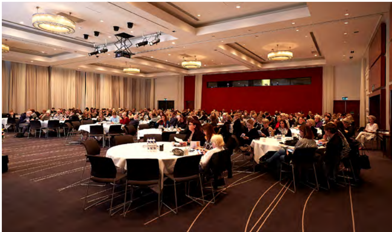
Félagsráðgjafafing 24. febrúar 2017 á Hilton Reykjavík Nordica.