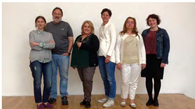
Stjórn Evrópuedeildar Alþjóðasamtaka félagsráðgjafa, IFSW Europe.

Á síðastliðnum árum hefur stjórn félagsins lagt áherslu á að auka þátttöku félagsráðgjafa í ráðstefnum, erlendum sem innlendum. Þriðja Félagsráðgjafafingrið var haldið nú í febrúar og í ár tóku um 340 manns þátt í deginum sem er orðin árleg uppskeruhátíð félagsráðgjafar á Íslandi. Félagsráðgjafar leituðu einnig þekkingar utan landsteinanna. Um sextíu íslenskir félagsráðgjafar tóku þátt í Evrópuráðstefnu félagsráðgjafa sem haldin var í Edinborg í september 2015, og voru átta Íslendingar með málstofur. Við ráðstefnuslitin bauð formaður Félagsráðgjafafélags Íslands evrópska félagsráðgjafa velkomna til Íslands á Evrópuráðstefnunna sem