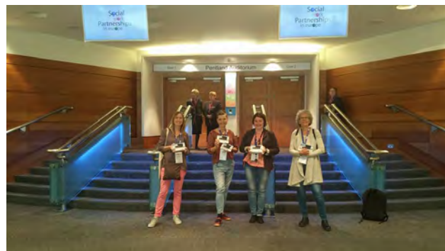
Stjórn og starfsmaður FÍ kynnr ráðstefnugestum í Edinborg, IFSW Europe ráðstefnunna á Íslandi 2017.