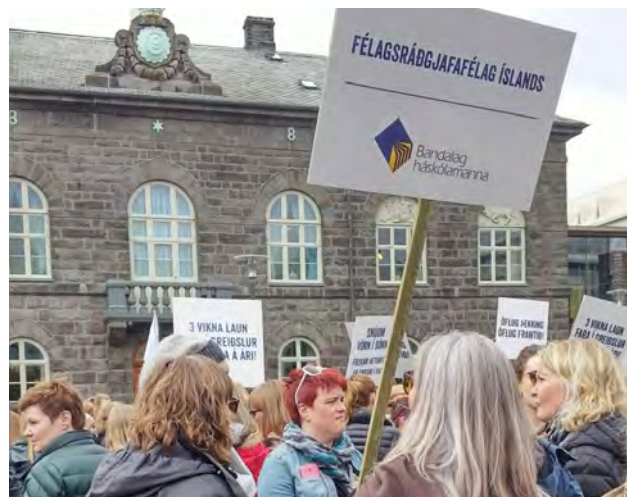
Verkfall BHM félaga sem starfa hjá ríkinu vorið 2015.

Í janúar 2014 hófust kjaraviðræður sem síðan hafa staðið því sem næst sleitulaust. Á vormánuðum var skrifað undir stutta kjarasamninga við Samband íslenskra sveitarfélaga og Reykjavíkurborg. Samningurinn við Reykjavíkurborg fól í sér umfangsmikla endurskoðun á starfsmati en samningurinn við Samband íslenskra sveitarfélaga fól í sér lagfæringar á launatöflu auk almennra launahækkana. Ekkert gekk hins vegar í samningaviðræðum við ríkið. Undir sumar var ákveðið að gera vopnahléssamning og hefja viðræður aftur í lok árs 2014. Enn gengu kjaraviðræður við ríkið afar illa. Ákvaðu aðildarfélög BHM að fara í verkfall til að freista þess að knýja fram kröfur sínar um að menntun skuli metin til launa. Hófst allsherjarverkfall hinn 9. apríl með þátttöku um þrjú þúsund félagsmanna. Aðildarfélög BHM stóðu saman að verkfallsaðgerðum þar sem ákveðnir hópar lögðu niður störf á mismunandi tímabilum en öll félögin lögðu fjármagn í sameiginlegan verkfallssjóð. Ekki kom til þess að félagsráðgjafar legðu niður störf nema þennan hálfan dag í apríl. Þrátt fyrir harðar verkfallsaðgerðir náðist ekki niðurstaða í kjaraviðræður við ríkið. Hinn 13. júní 2015 stöðvaði Alþingi verkfallið með lagasetningu og kváðu lögin