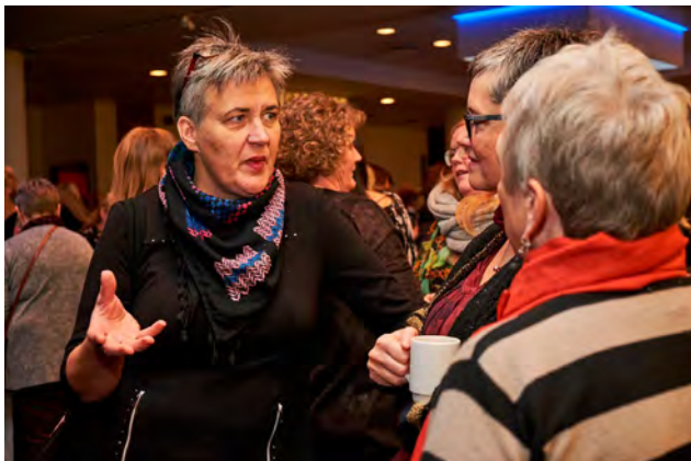
Milli erinda gafst gott tækifæri til umræðna

Þess fólks sem hrakist hefur frá heimilum sínum. Það féll vel að fréttum sem þá voru efstar á baugi af mansali sem átti sér stað í Vík í Mýrdal.