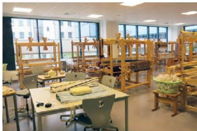
Vinnustofa í Quo Vadis

„Quo Vadis?“ er valdeflingar- og framleiðslumiðstöð fyrir innflytjendur (e. Growth and Production Centre for Immigrants). Hópurinn heimsótti skóla-byggingu fyrir konur þar sem unnið er að fjárhagslegu sjálfstæði og bættri sjálfsmynd þeirra. Kennnd er norska og önnur undirstöðumenntun. Þar eru vinnustofur með vefstólum, þrjónavélum, saumavélum og keramikstofa. Framleiðslan er seld í verslun „Quo Vadis?“ ásamt öðrum varningi eins og Hal-Al kjöti.