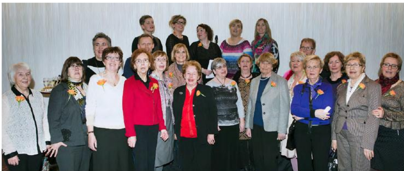
Á Félagsráðgjafafínginu voru fyrrum formenn félagsins og ritnefnd Félagsráðgjafafélagsins heiðruð.

Á þinginu voru átján málstofur þar sem fluttir voru um sjötu fyrirlestrar um málefni sem félagsráðgjöfum eru hugleikin og þeir starfa við, svo sem fjölskyldumeðferð, endurhæfingu, ofbeldi í fjölskyldum, þjónustu við aldraða, fatlað fólk og innflytjendur, barnavernd, fjárhagsaðstoð sveitarfélaga, skólafélagsráðgjöf, vinnu með börnum og fjölskyldum, hamfarir, handleiðslu, fagþróun og velferð barna. Þátttaka á þessu fyrsta félagsráðgjafafíngi fór fram úr hjórtustu vonum en um 340 félagsráðgjafar og aðrir áhugasamir um félagsráðgjöf tóku þátt í dagskránni. Þingið hófst með setningu formanns Félagsráðgjafafélags Íslands. Að henni lokinni ávarpaði Eygló Harðardóttir, félags- og húsnæðismálaráðherra þingið. Hrósaði hún félagsráð-